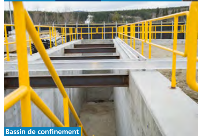
Bassin de confinement

Énergie Yukon a procédé à la mise en œuvre du projet parce qu'elle est persuadée que ses installations et le GNL sont sécuritaires pour tous les résidents du Yukon et pour son personnel.