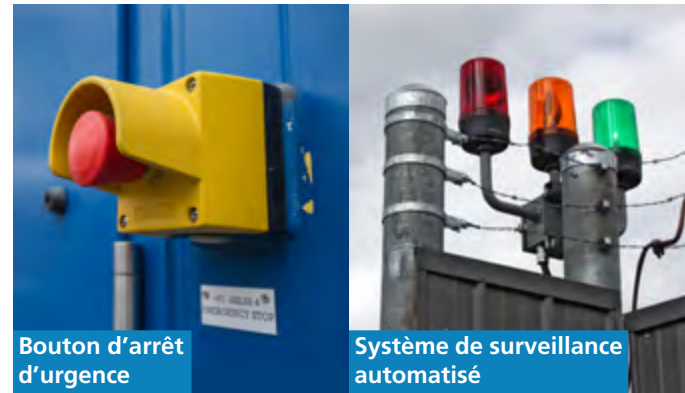
Bouton d'arrêt d'urgence